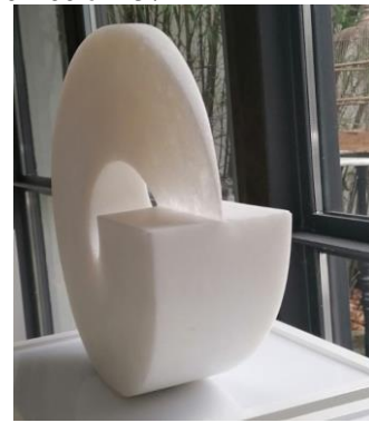
Ingbert Brunk „Aus dem Licht“ 36 cm, Naxos Marmor