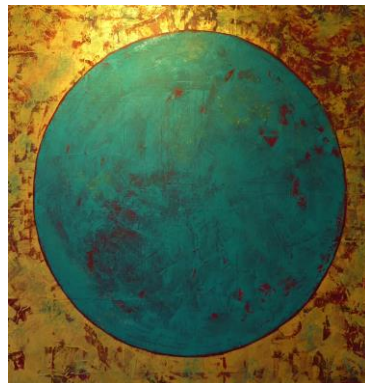
Gina Feder „Zen 2“ 90 x 90 cm Öl/LW