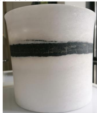
Ingbert Brunk „Gefäß mit schwarzem Ring“ Höhe 26 cm, Naxos Marmor