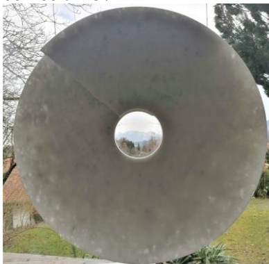
Ingbert Brunk „Hängende Spirale“ 70 cm Naxos Marmor